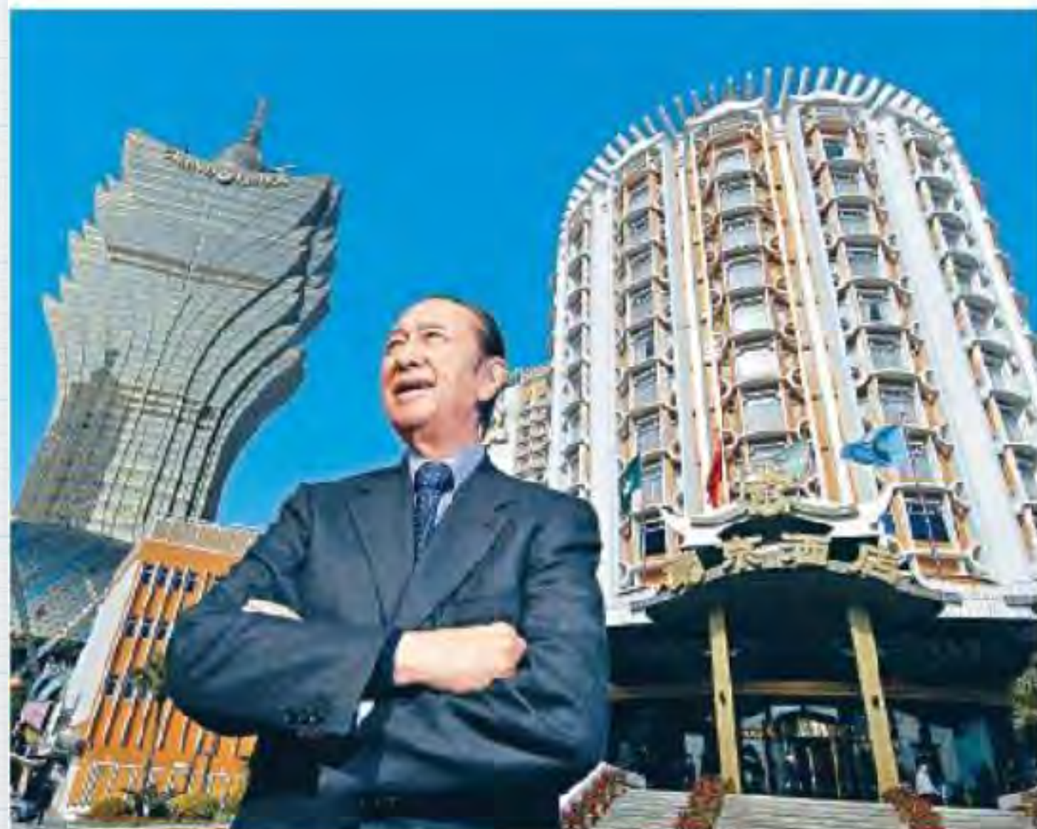
■ 賭王逝世消息傳出後，其家族持有的相關股份昨日急升，其中信德集團飆升近22%。

賭王何鴻燊逝世消息傳出後，其家族持有的相關股份，昨日股價急升，其中信德集團(242)飆升近22%，澳博控股(880)則升7.2%。有分析指，股價上升為市場投機動作，相信其家族分工上未有任何改變，又料澳門旅遊業將於下半年復甦，對博彩業未來看法審慎樂觀。